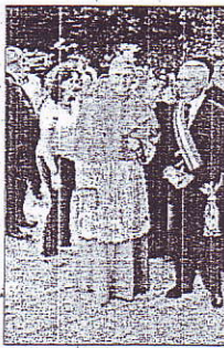
valore storico e culturale.

Date le proporzioni dell'edificio e le numerose possibilità di riconversione dello stesso sarebbe doveroso procedere a una apposita richiesta di finanziamento presso diverse Fondazioni Bancarie, al fine di conservare un Bene in sé armonico dal punto di vista architettonico, ma soprattutto di considerarlo